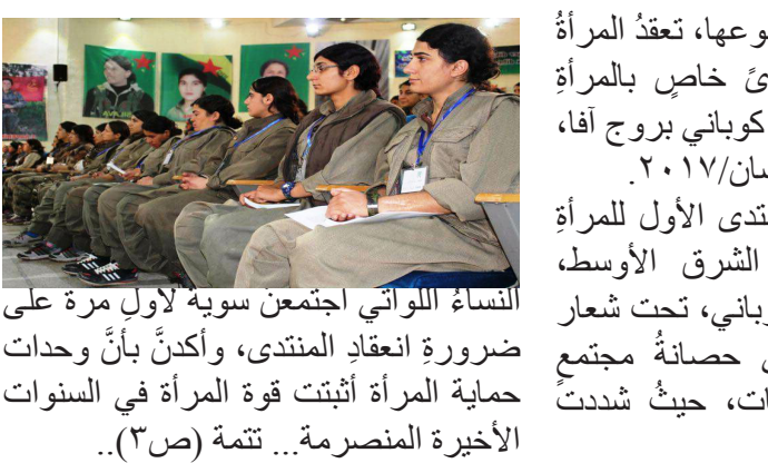
المنتدى الأول للمرأة في كوبياني

في ظل استمرار السلطات التركية بقيادة زعيمهم رجب طيب اردوغان بحملة الاعتقالات الموسعة في صفوف وقادة أعضاء حزب الشعوب الديمقراطي وغيرهم العديد من الرؤساء، بحجة تصفية جميع القوى السياسية المعارضة لنظام حزب.