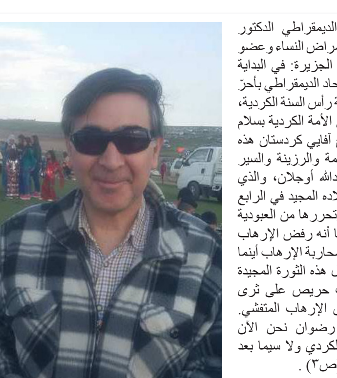
فلنعمل سوياً لبناء روج آفا حرة