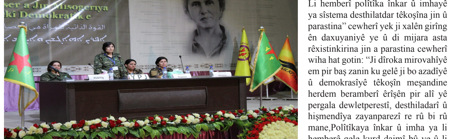
Daxuyaniya Komcivîna Jin û Parastinê