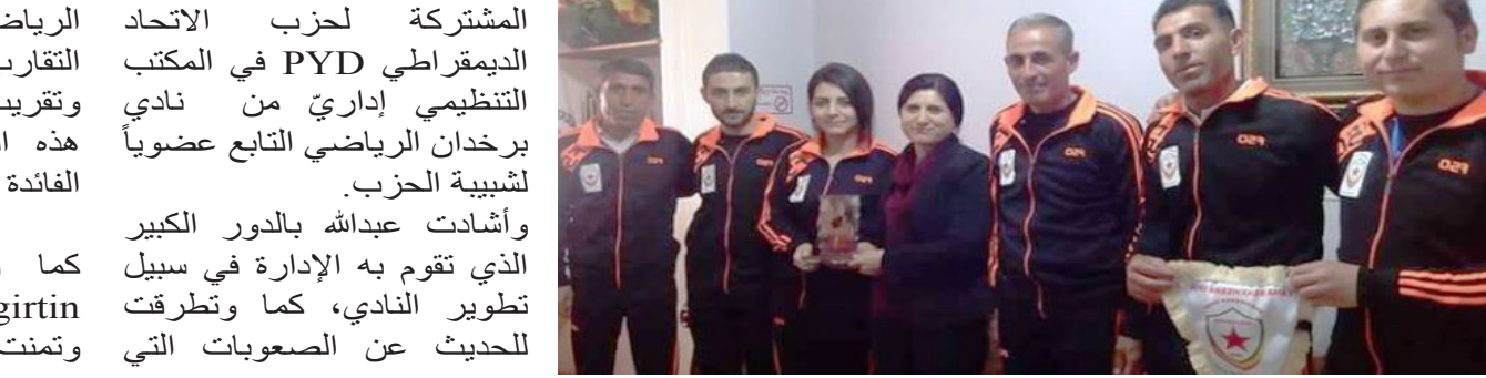
اداريّ نادي برخدان يقدمون درع تذكاري للرئاسة المشتركة

تمت بها المنطقة، وبأن دور الرياضة مهم في مجال تحقيق التقارب الاجتماعي بين الشباب، وتقريب وجهات النظر في ظل هذه الظروف، بالإضافة إلى الفائدة الصحية للرياضة.