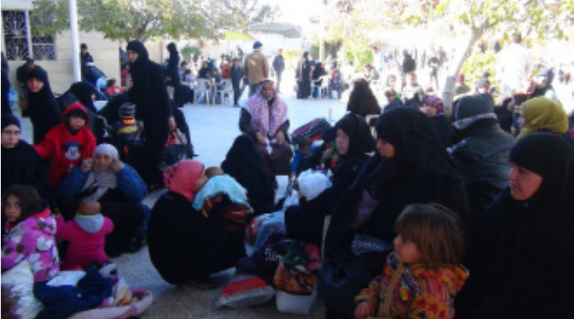
dagirkirina Tirkîyê ji xaka Sûriyê re qebûl nakin û şermezar dikin