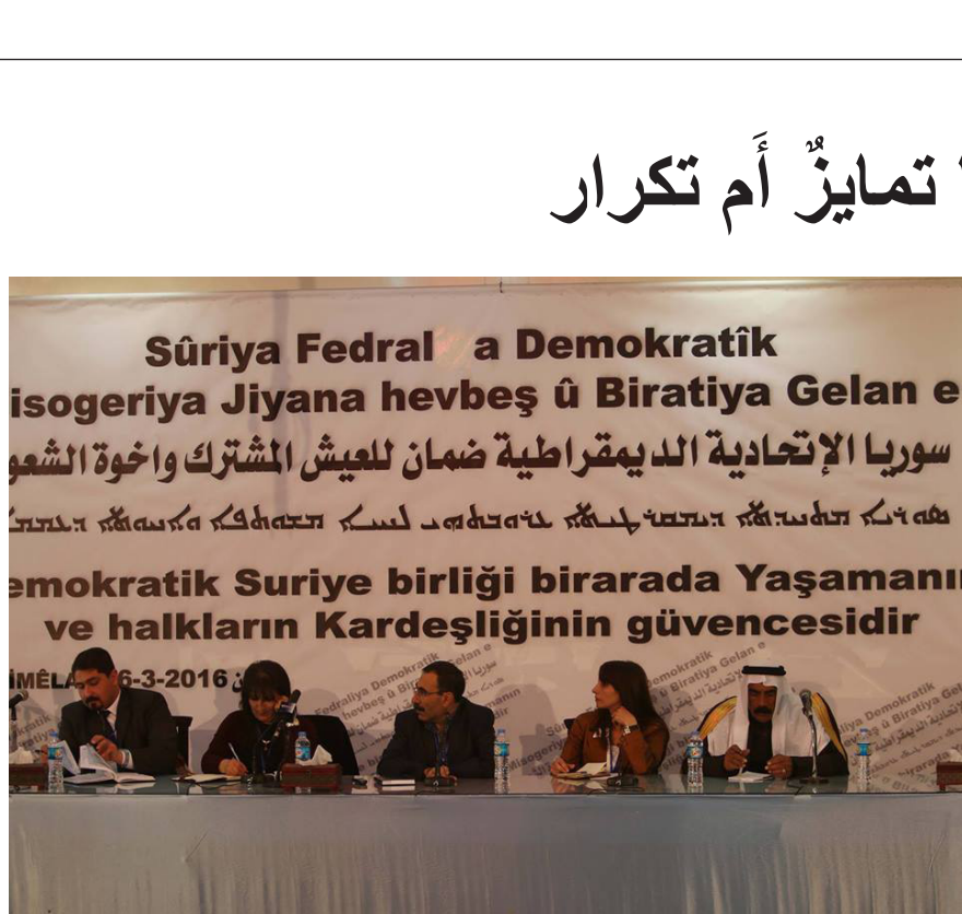
www.pydrojava.com / pyd.roj@gmail.com

لذا نحن على ثقة تامة بصوابية فلسفة القائد أوجلان وأنها الإرث تدعونا لتكون على ثقة بأن المرأة في الفيدرالية الديمقراطية ستكون على قدر كبير من النجاح والمسؤولية الموكلة ليهيأ. ونجاحها هذا لن يقتصر على المرأة الكردية فقط بل يتعدى إلى أن يكون للمرأة السورية من المكونات الأخرى الدور الفعال جميع المكتسبات السياسية لروج آفا كنا روجين ومن الإدارة الذاتية الديمقراطية على وضع نسبة تمثيّل للمرأة وهكذا الأمر في مجلس سوريا الديمقراطية. ففي المجلس الفيدرالي الديمقراطي أيضاً تختم الضرورة لوجود نسبة تمثيّل للمرأة بغية تحقيق المساواة مع الرجل في الحقوق والواجبات إلى جانب أنه ضمانه من التمداد الناجحة